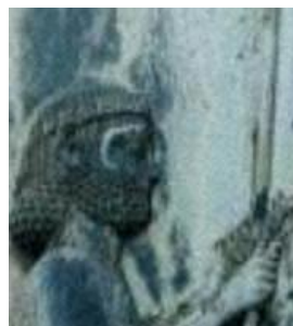
(ب) روش بزرگنمایی Bicubic